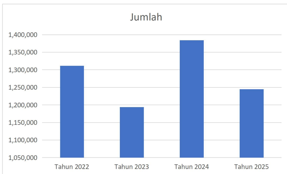
Grafik pengunjung pertahun

Pengunjung melalui website selalu mengalami kenaikan dari tahun ketahun mulai dari tahun 2022 jumlah pengunjung 27.209 kemudian pada tahun 2023 menjadi 45.318 kemudian tahun 2024 mengalami kenaikan yang signifikan yakni dengan jumlah pengunjung 76.241 kemudian pada tahun 2025 juga mengalami kenaikan dengan jumlah pengunjung 86.391. hal ini terjadi peningkatan minat terhadap akses informasi online dan digitalisasi layanan perpustakaan.